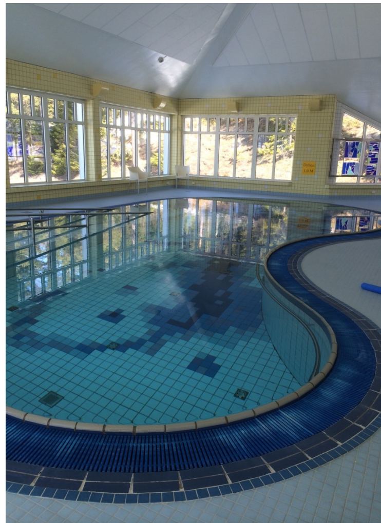
Foto: Svømmebasseng ved Montebello-Senteret, Mesnali